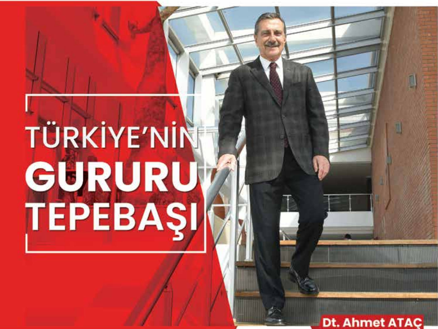
Dt. Ahmet ATAÇ Eskişehir Tepebaşı Belediye Başkanı

TEPEBAŞI BELEDİYESİ / 2022 / SAYI 35 / ÜCRETSİZ