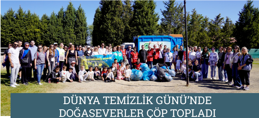
DÜNYA TEMİZLİK GÜNÜ'NDE DOĞASEVERLER ÇÖP TOPLADI

Tepebaşı Belediyesi, temiz bir çevre için sivil çevre hareketlerinden biri olan "Let's Do It Türkiye" ile tüm dünyada eş zamanlı düzenlenen farkındalık amaçlı çöp toplama etkinliği gerçekleştirdi.