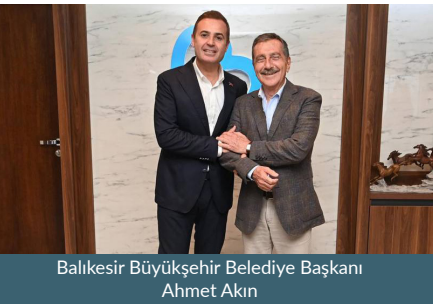
Balıkesir Büyükşehir Belediye Başkanı Ahmet Akın