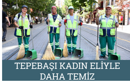
TEPEBAŞI KADIN ELİYLE DAHA TEMİZ

Ellerinde süpürge ile cadde ve sokakları temizleyen kadınlar hem çalışkanlıklarıyla hem de azimleriyle takdir topluyor.