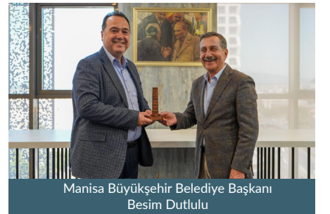
Manisa Büyükşehir Belediye Başkanı Besim Dutlulu