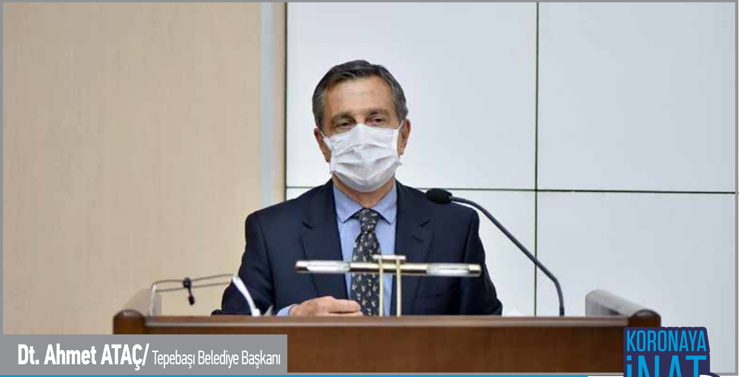
Dt. Ahmet ATAÇ/ Tepebaşı Belediye Başkanı